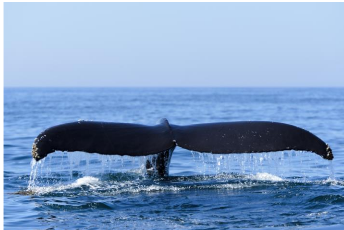
Whale Watching in Nova Scotia

Die Provinz Nova Scotia liegt an der Ostküste Kanadas und besteht im Wesentlichen aus einer Halbinsel im Atlantischen Ozean und Cape Breton Island, nordöstlich des Festlandes. Unzählige Buchten und Fischerorte säumen die Küste. Nova Scotia ist flächenmäßig die zweitkleinste Provinz Kanadas und kein Ort ist mehr als 56 km vom Meer entfernt. Mit knapp unter 1 Million Einwohner, 11 Universitäten und über 80 High Schools hat die Provinz die höchste Dichte an Bildungseinrichtungen in Kanada. Das milde Klima macht die Provinz zu einem perfekten Ort für Austauschschüler. Die zwei Nationalparks der Provinz sind der Cape Breton Highlands-Nationalpark im Norden und der Kejimikujik Nationalpark im Süden.